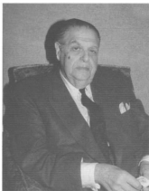
فؤاد باشا سراج الدين الزعيم الثالث لحزب الوفد